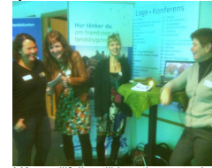
Många tillfällen till kreativa möten!

Företagardagen 16 oktober deltog Bygd och stad i balans på Företagardagen i Fjällräven center.