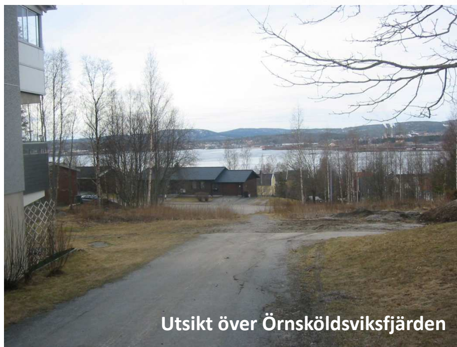
Utsikt över Örnköldsviksfjärden